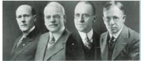
最初のロータリークラブ役員 左から創始者のポール・ハリス、ジ ョージ・シール、ウィリアム・ジェンソン、ハリー・ ワグネル

現在、世界200数カ国の地域にあり、クラブ数33,586、会員総数121万人を数えます。これら世界中のクラブの連合体を国際ロータリー（RI）と称します。