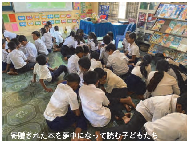
寄贈された本を夢中になって読む子どもたち

第2750地区（東京都）米山学友会では今年2月、カンボジアの子どもたちに本を読む習慣を身に付けてほしいと、ミニ図書館や文房具、また、サッカーボールなどスポーツ用品を小学校へ寄贈する奉仕活動を行いました。